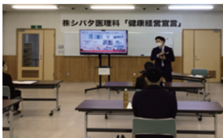
先輩社員による説明